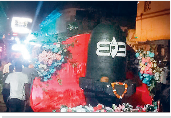
पलारी के ओंकारेश्वर शिव मंदिर में जगमगाई 303 मनोकामना ज्योति

सुबह से ही जिले के मंदिरों में पूजा-अर्चना के लिए भक्त पहुंचने लगे थे। गांव-गांव ओम नमः शिवाय पंचाक्षर मंत्र से गुंजायमान हो रहे थे। हर कोई भगवान शिव की भक्ति में डूबा दिखा। जहां एक ओर जिले के प्रसिद्ध मंदिरों में भक्तों की भारी भीड़ थी। वहीं, कई भक्तों ने अपने घरों में स्थित शिवलिंग की भी विधि-विधान से पूजा अर्चना की। वहीं मंदिरों में भगवान के दर्शन के लिए पहुंचे भक्तों के लिए भी मंदिर समितियों द्वारा विशेष व्यवस्था की गई थी। मंदिरों में पहुंचने वाले भक्तों के माथे पर त्रिपुंड लगाने की व्यवस्था भी की गई थी, जिसे हर श्रद्धालु लगाना चाह रहा था। अष्टांग चंदन के बने इस तिलक से माथे पर ओम नमः शिवाय का प्रतीक चिह्न लोगों को भक्ति से सराबोर कर रहा था। वहीं, मंदिर समितियों द्वारा महाशिवरात्रि के अवसर पर विभिन्न भक्तिमय कार्यक्रमों के साथ भण्डारे का भी आयोजन किया गया था।